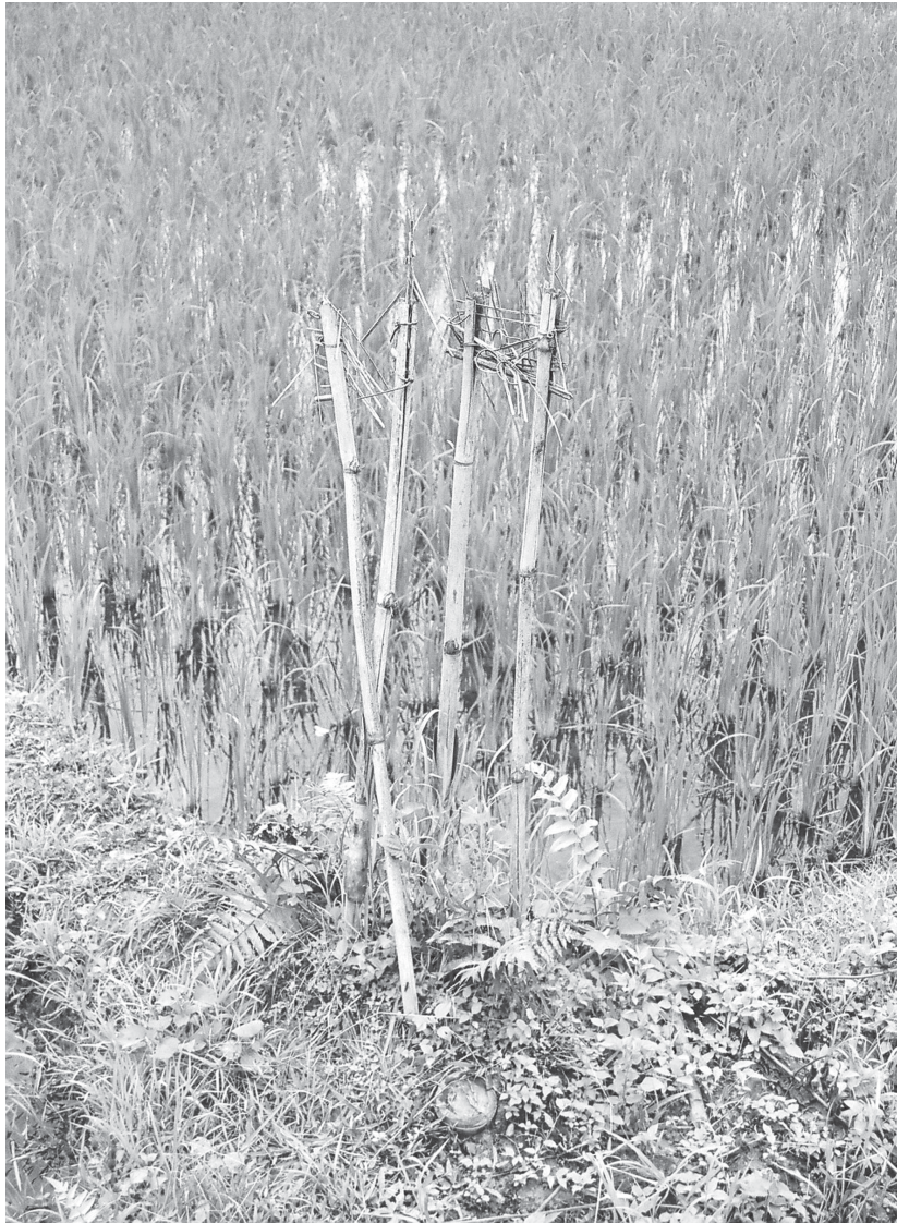
ภู เชียงดาว