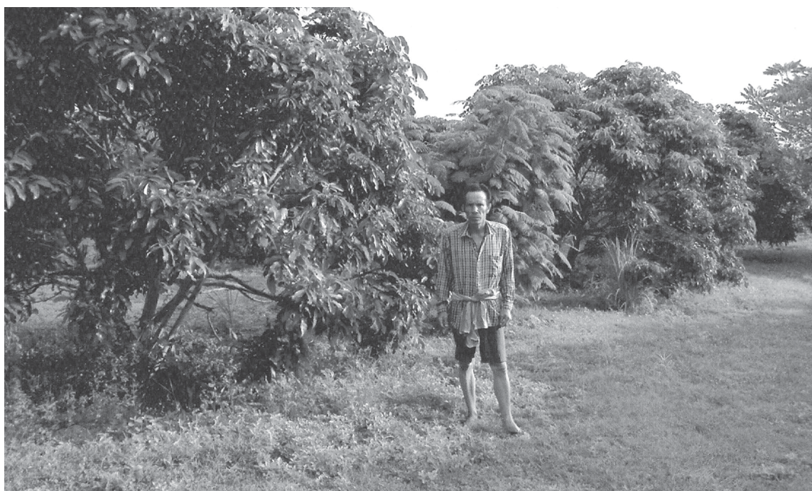
ภู เชียงดาว

เมื่อชาวบ้านเห็นว่าที่ดินผืนดังกล่าวถูกทิ้งร้างมานานมากกว่า 40 ปี ทั้งที่เป็นพื้นที่ที่สามารถทำการเกษตรได้ การปล่อยให้ทิ้งร้างเท่ากับสูญเสียประโยชน์และมูลค่าของการผลิตไปโดยเปล่าประโยชน์ ที่สำคัญพื้นที่ที่รกไปด้วยป่าวัชพืชมักทำให้เกิดไฟป่าที่ไหม้ลุกลามเข้ามายังสวนชาวบ้านที่อยู่ใกล้เคียง ประกอบกับเงื่อนไขความต้องการที่ดินเพื่อการปลูกพืชพาณิชย์ และแรงกดดันด้านประชากรที่เพิ่มขึ้นจากภาวะวิกฤติเศรษฐกิจ ทำให้ชาวบ้านมีความคิดและเริ่มที่จะเข้าไปทำการเพาะปลูกในพื้นที่ดังกล่าว